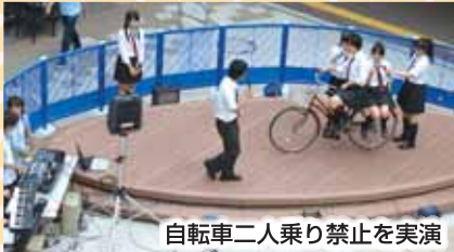
自転車二人乗り禁止を実演