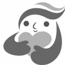
犯罪被害者等支援 シンボルマーク 「ギョっとちゃん」

http://www.pref.kanagawa.jp/cnt/f4181/p848565.html