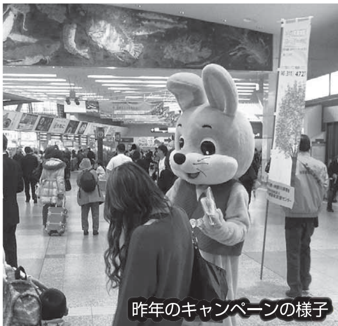
昨年のキャンペーンの様子