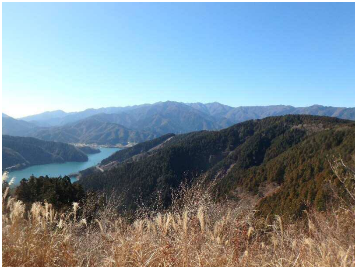
（写真 1 南山山頂からの眺め）

●南山山頂や権現平は広大な展望に恵まれた所です。南山山頂からは、眼下にダイナミックに迫る宮ヶ瀬ダムを見下ろせます。積雪期には、蛭ヶ岳方面の尾根上にできる白馬の雪形がよく見えることでも知られています。残念ながらこの冬はまだ、まとまった雪が降っていないので、白馬はお預けとなりました。（写真 1、2、3）