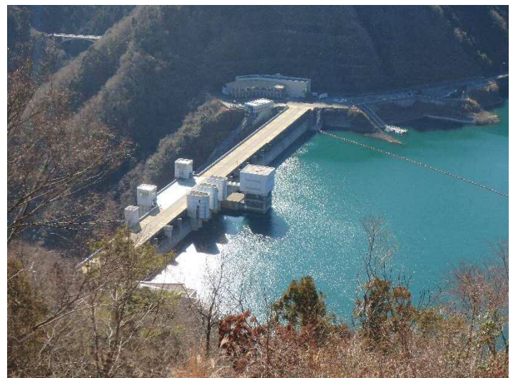
（写真 2 眼下に見下ろす宮ヶ瀬ダム）