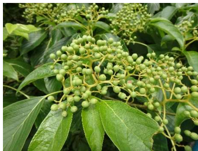
クマノミズキの実