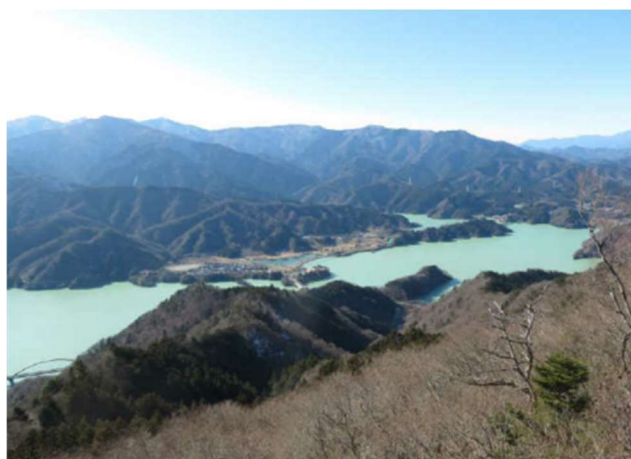
令和2年1月撮影（高取山山頂）