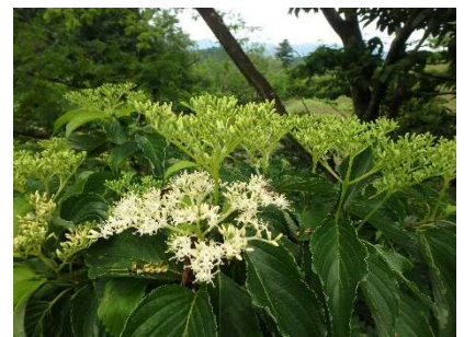
クマノミズキの花

●曇り空が続いていましたが、下山時に晴れてきました。木漏れ日の中を歩くは気持ちがいいものです。