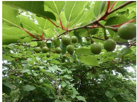
アブラチャンの実