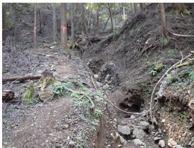
荒廃している様子

※注意喚起のためロープを張っています。看板の内容を確認し、ロープを越えて通行ください。