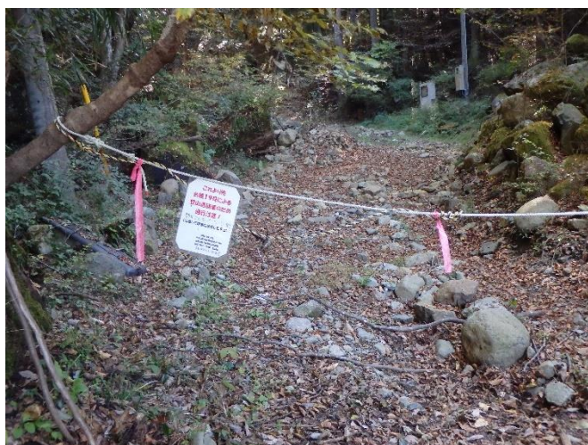
平丸登山口の注意看板

● 青根や伏馬田では令和元年の台風の影響が大きかった地域で、現在も通行止めの区間があります。本コースは通行できますが、登山口から約800メートル付近まで荒廃しています。通行の際には十分に注意をお願いします。