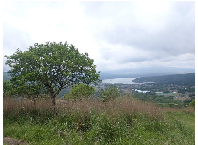
高指山山頂からの眺め

●ニホンジカの群れと遭遇しました。登山道を横切るシカの列はなかなか途切れず、15から20頭ほどいました。出会った登山者よりも多い数です！周辺にはシカの痕跡が見られました。