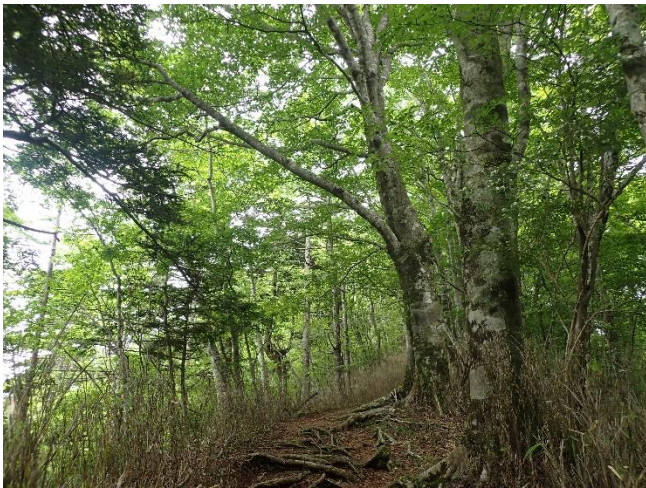
ブナ林のしずかな登山道

●このコースは、甲相国境尾根（神奈川と山梨の県境）を歩きます。ブナ林のなだらかな尾根道です。富士岬平や高指山山頂は開けた草地となっていて、山中湖・富士山方面の大展望があります。富士山はあいにく雲の中でしたが、丹沢西端エリアならではの景色です。