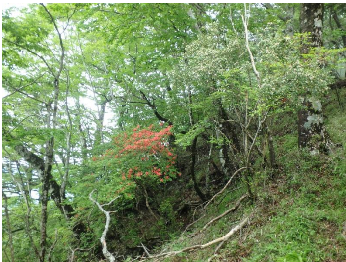
ヤマツツジとツクバネウツギの共演