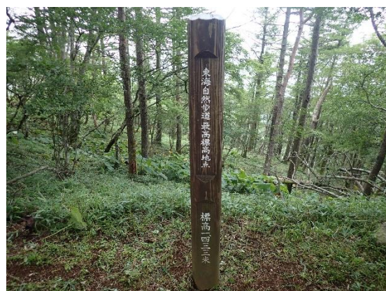
東海自然歩道最高標高地点