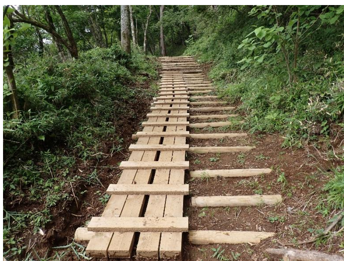
昨年度整備した木道

●東海自然歩道は、東京から大阪までを結ぶ1,697キロメートルの長距離自然歩道です。姫次の少し手前には東海自然歩道の最高標高地点（標高1,433メートル）があります。立派なブナの大木がたたずむ雰囲気の良い場所です。