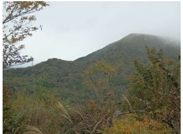
高指山山頂付近からの眺め

●高指山山頂のススキはそろそろ見ごろのようです。たまに霧雨の降る生憎の天気で、富士山どころか山中湖も霧の中。一度切れ間から湖の一部が見えたので少し報われました。