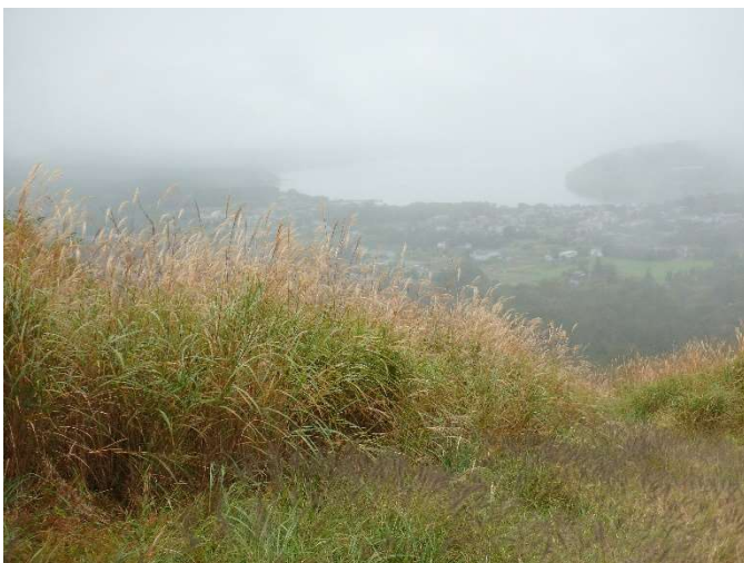
高指山山頂のススキはそろそろ見ごろ

●高指山山頂のススキはそろそろ見ごろのようです。たまに霧雨の降る生憎の天気で、富士山どころか山中湖も霧の中。一度切れ間から湖の一部が見えたので少し報われました。