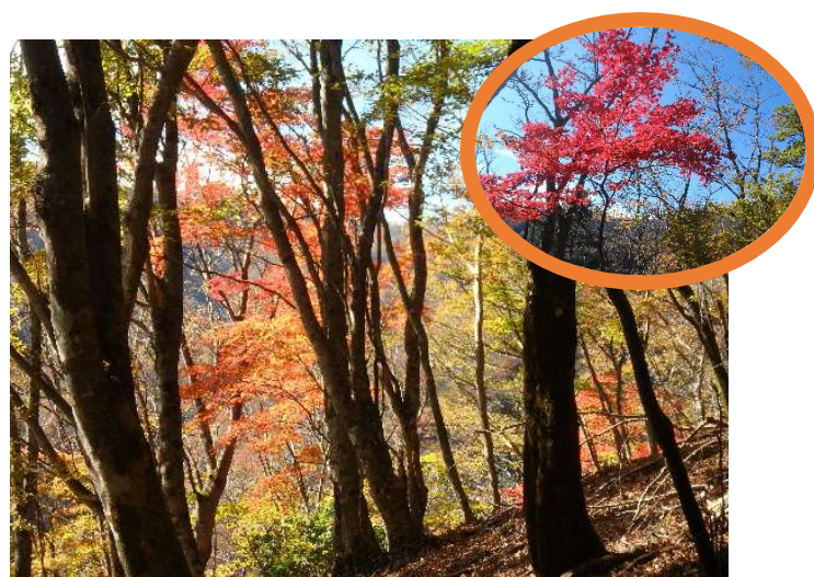
大平からの尾根では所々で赤色のカエデ類も