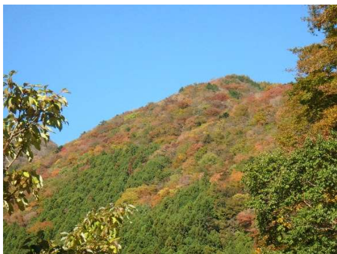
林道から見た周辺の様子