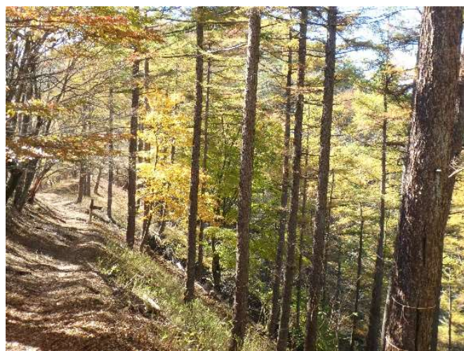
平丸分岐のカラマツ林