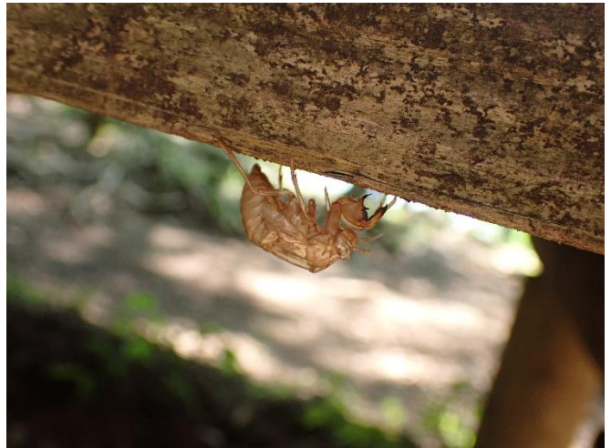
野外卓の下にあったセミの抜け殻