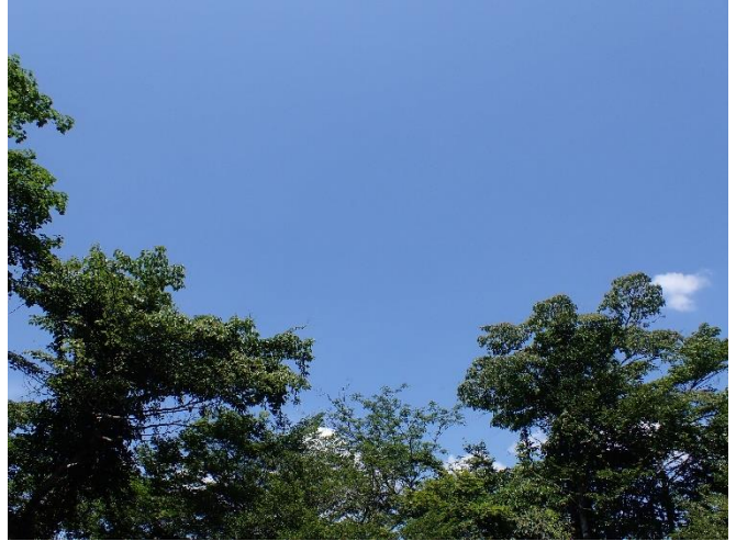
城ヶ尾山山頂から見た空

●野外卓の点検をしていると、まるでスズメバチのような虫がいました。ぎょっとしましたが、よく見るとアブの仲間でした。他にも小さな生き物がいました。