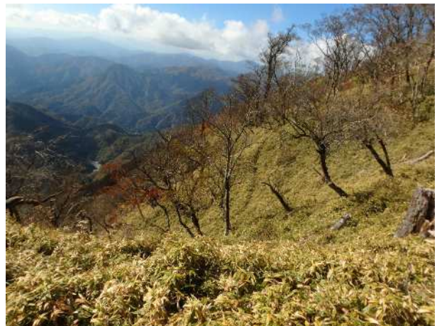
熊笹ノ峰山頂周辺

●神ノ川林道の神ノ川公園橋までは登山者は通行できますが、そこから先は通行止めなのでご注意ください。