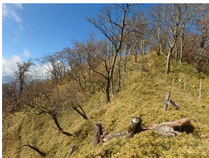
熊笹ノ峰山頂周辺