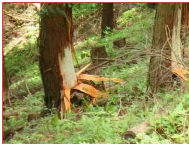
令和3年の樹皮剥ぎ

●焼山山頂の気温は8℃でした。風もあって体感温度はさらに低く感じ、手袋をしても指先はかじかみました。平地の暖かさに惑わされず、防寒の備えを忘れなく。