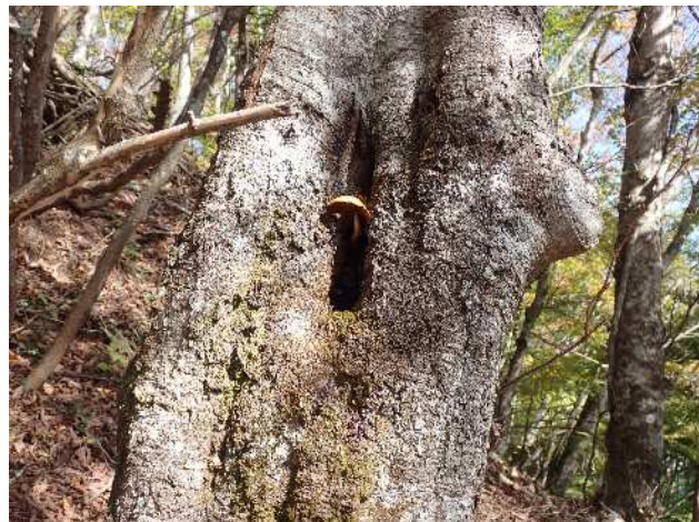
キノコが樹洞から顔を覗かせていました。