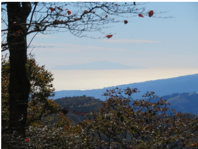
大界木山付近から伊豆大島