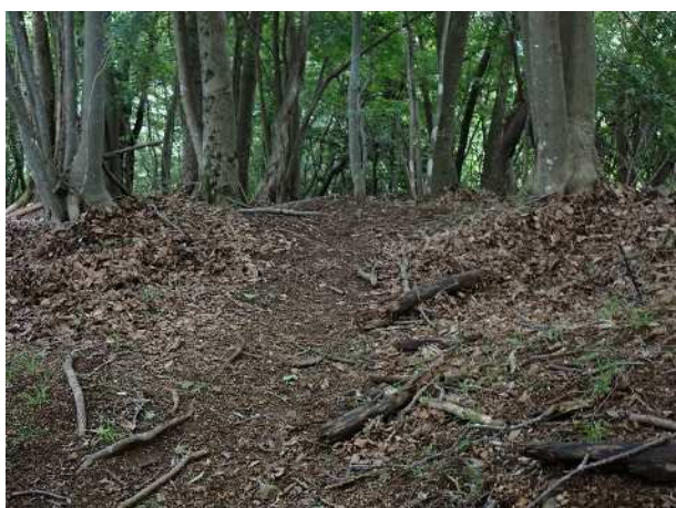
落ち葉かきをした登山道

●ヤマビルに注意をしたい場所ですが、この日はあまり見かけませんでした。篠原から山頂までの登山道は、落ち葉かきがしてあるようでした。冬季に行くことでヤマビルの生息しにくい環境をつくることができます。