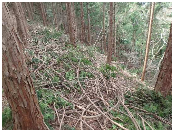
間伐・枝打ち直後（2016年）