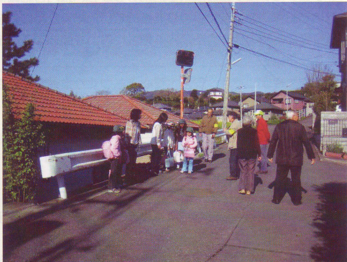
真鶴町城北安全・安心防犯パトロール

「東富水地区市民防犯パトロール」では、児童の登下校の時間に合わせて通学路上に立ち、「おはよう」「おかえり」の声かけをしながら子どもたちの安全確保に努めています。