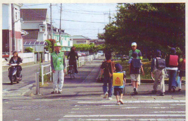
東富水地区市民防犯パトロール

「真鶴町城北安全・安心防犯パトロール」では、毎月第一月曜日を『防犯強化日』と定め、地域内活動拠点を定めて、路上で通勤通学者とあいさつを交わしています。特に、小さい子どもたちを安全に登校させる手助けをしています。毎日参加している隊員もいます。