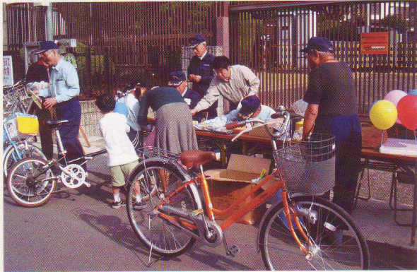
大窪地区防犯連絡会

県西部、小田原警察署管内においても、銀行強盗や不審者の出没、振り込め詐欺の被害が多いなど体感治安が十分よいとはいえない状況が続いています。こうした中、各地で地域の実態に合った防犯活動が展開されています。