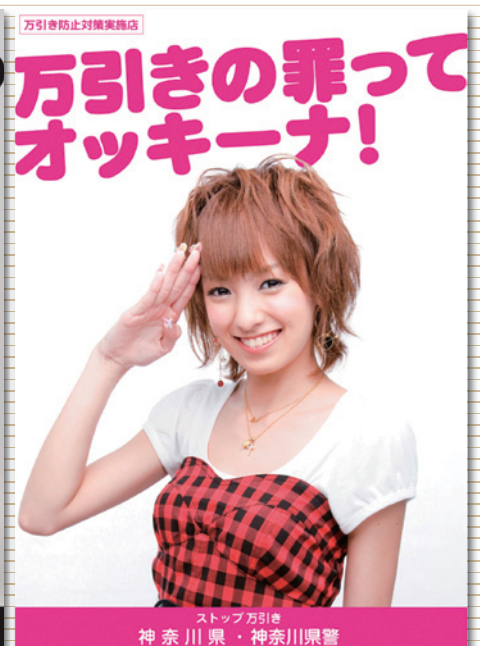
ストップ万引き 神奈川県・神奈川県警 タレント 南明奈さん