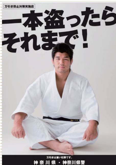
万引きは重い犯罪です。 神奈川県・神奈川県警 柔道家 井上康生さん