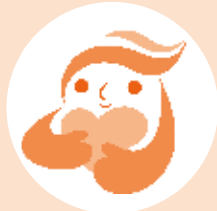
犯罪被害者等支援 シンボルマーク 「ギョっつとちゃん」