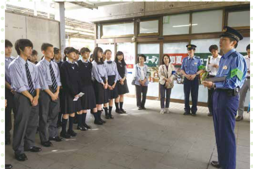
保土ヶ谷駅前での「痴漢防止キャンペーン」団結式

「セーフティかながわユースカレッジ」では、インターアクトクラブがこれまで実践してきた防犯活動を発表するとともに、県内外の学生・生徒と学びを深めました。次回の防犯キャンペーンをどう行っていくべきかということのアイデアを得て、地元の方々との協力を密にし、保土ヶ谷から世界へ発信し続けていきます。