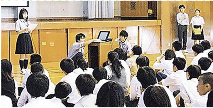
横浜市立橋中学校3年生向けの非行防止教室 「#君に届け!!～最後の中学校生活」