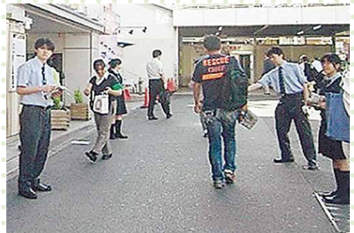
保土ヶ谷駅前での「痴漢防止キャンペーン」