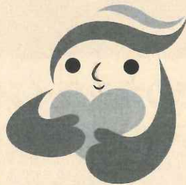
犯罪被害者等支援 シンボルマーク 「ギョッとちゃん」