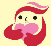
犯罪被害者等支援 シンボルマーク 「ギュっとちゃん」