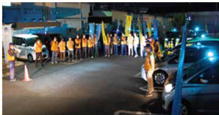
青パトの一斉出発式(9月30日 睦合南公民館)

安心・安全なまち会議は、12自治会長をはじめ、3小中学校長、自治会防犯部長など41人で組織。当地区の青色回転灯装備車両青パトは28台を有し、市内15地区で最大の所有台数を誇っています。この充実した体制の中で、学校と連携した地域の安心・安全な取り組みの推進役となっています。