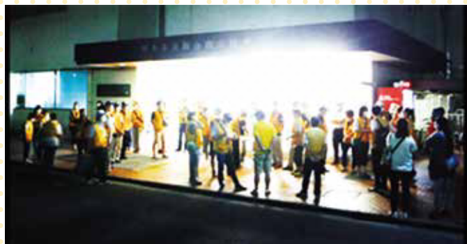
安心・安全なまち会議と青少年健全育成会の合同パトロール(8月8日 睦合南公民館)

今年、コロナ禍の中で民間交通監視所の設置や各種キャンペーンなど、活動が思うように実施できない状況が続いてきましたが、9月30日に地区の独自事業として青パトの一斉出発式を実施しました。この日は、地区内を隈なく巡回し、安心・安全の活動を広くアピールするよい機会となりました。