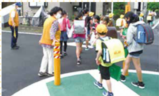
小学校の授業が再開し子供たちの見守り活動を再開(6月)

厚木市は、2010年からWHOが推奨するセーフコミュニティ SC 国際認証を取得し、「地域の誰もがいつまでも健康で幸せに暮らせるまち」を目指し取り組んでいます。睦合南地区は、認証取得する前から「事故やケガの原因を分析し予防に取り組む」という SC 活動に取り組む先進的な地区です。