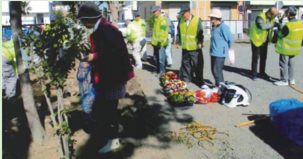
▲花植え活動を行う平塚市防犯協会富士見支部の皆さん

令和2年度「神奈川県犯罪のない安全・安心まちづくり功労者表彰奨励賞」をいただき感謝しております。部員一同大いに喜び、活動の励みとなりました。