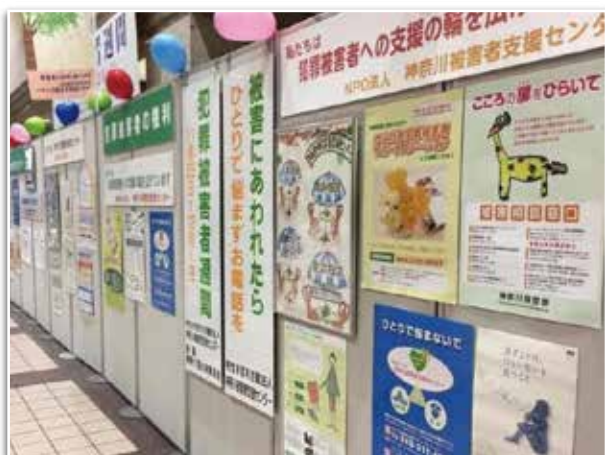
※ 写真は令和元年度のキャンペーンの様子です。