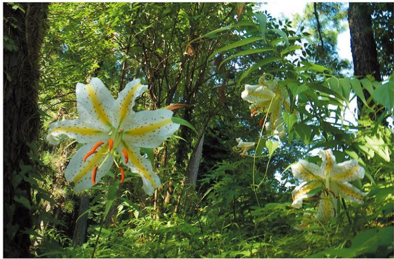
神奈川県の花 やまゆり