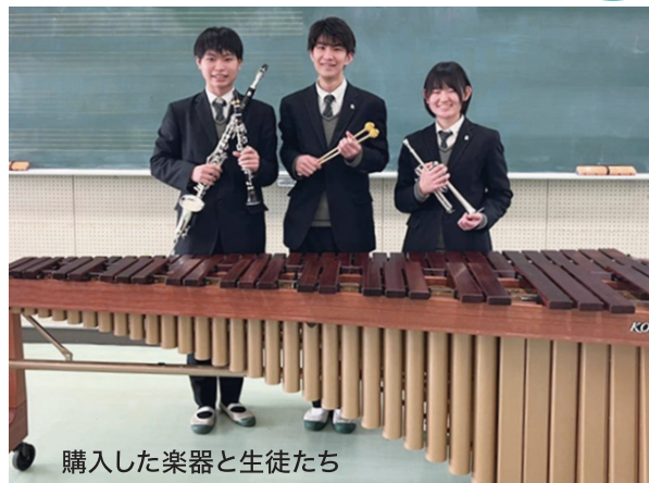
購入した楽器と生徒たち