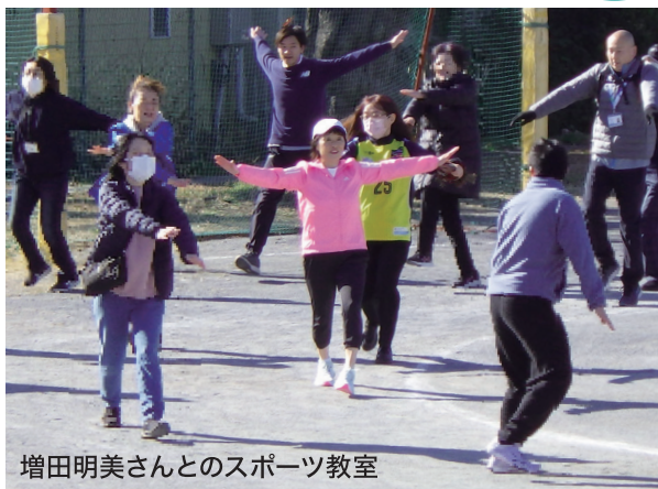
増田明美さんとのスポーツ教室