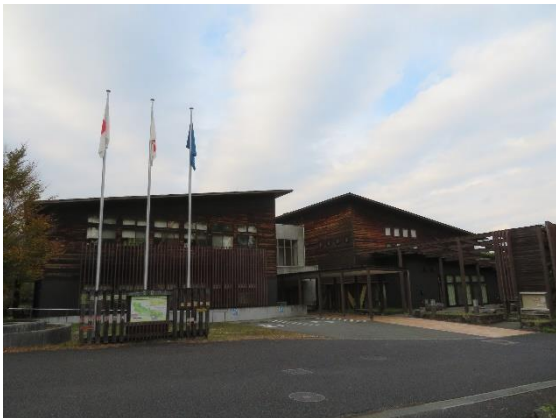
自然環境保全センター