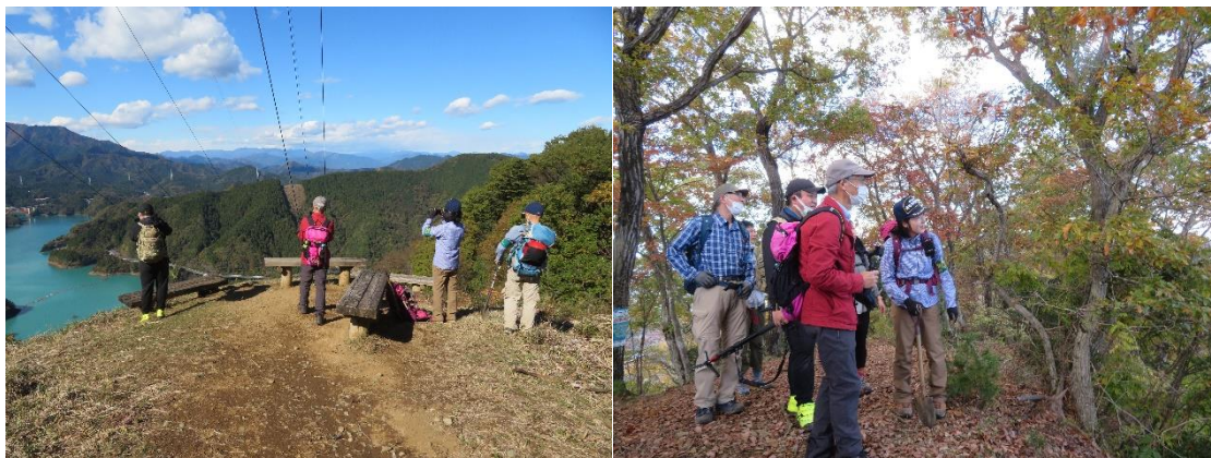
展望や紅葉も撮影しています