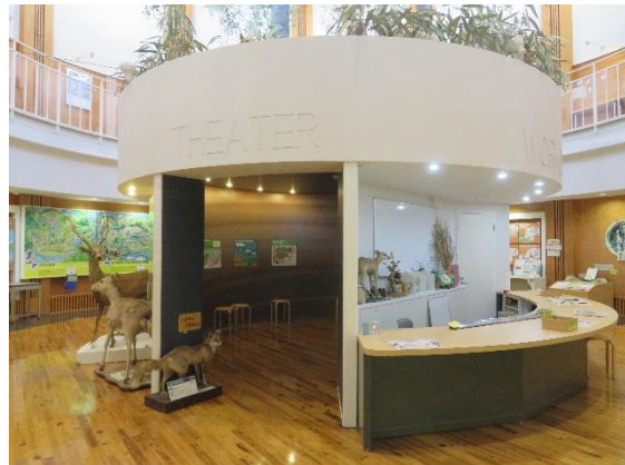
ミニシアター入口