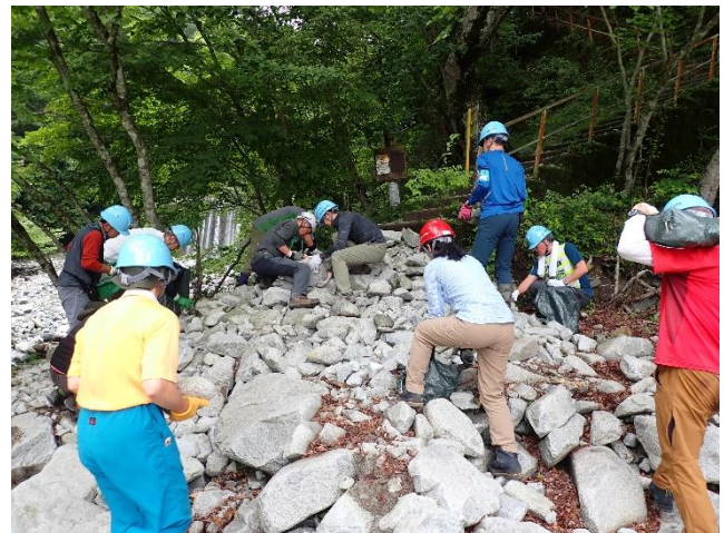
石を積み重ねる様子