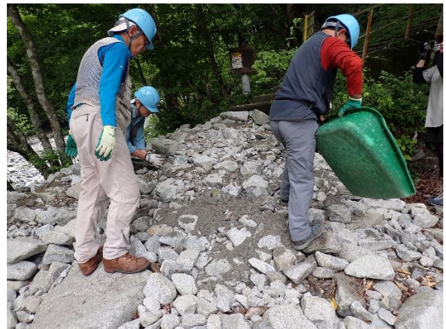
仕上げに砂利で石を固定