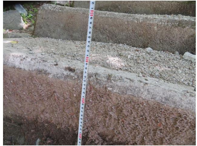
階段に上がる手前の段差（作業前）