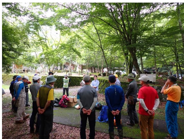
補修内容の説明の様子