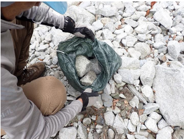
石の運搬に土嚢袋を活用