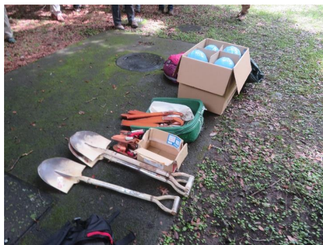
補修で使用した道具