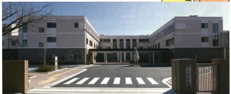
県立子ども自立生活支援センター(乳児院・福祉型障害児入所施設・児童心理治療施設)平成29年開設