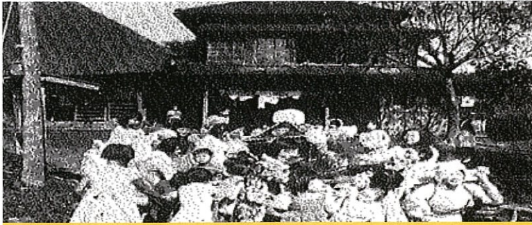
県立中里学園(児童養護施設・乳児院)昭和21年設置