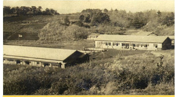
県立ひばりが丘学園(福祉型障害児入所施設)昭和24年設置