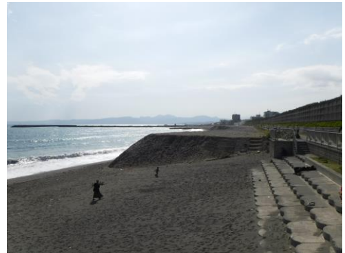
養浜(茅ヶ崎市中海岸)