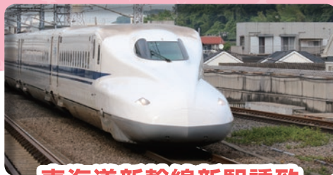
東海道新幹線新駅誘致

新駅設置に向けた最大の課題は、東海道新幹線の列車ダイヤが過密であることですが、リニア中央新幹線が開業すると、「のぞみ」の機能がリニアに移るため、新駅設置の可能性が高まります。期成同盟会では寒川町倉見地区への新駅誘致に取り組んでいます。あわせて、新駅誘致の受け皿となる新たなまちづくりを進めています。