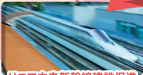
リニア中央新幹線建設促進

リニア中央新幹線は、平成26年10月、品川・名古屋間の工事実施計画が認可され、本県では、「橋本駅付近」に県内駅が設置されることとなり、令和元年の11月に駅工事の起工式が行われました。令和9年の品川・名古屋間の開業に向け、期成同盟会では、沿線自治体と連携を図りながら、国やJR東海等への要望活動や、普及啓発活動等に取り組んでいます。