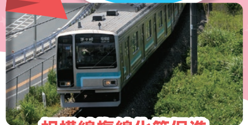
相模線複線化等促進

相模線は、全国との交流連携の窓口となる南北二つのゲートを繋ぐ役割を果たす重要な路線の一つです。しかし、単線であるため、列車の行違いの待ち時間等により表定速度が低く、運行本数も少ないことから、輸送サービスの改善が強く望まれています。期成同盟会では、複線化の早期実現や沿線地域の発展を目指して、各種活動に取り組んでいます。