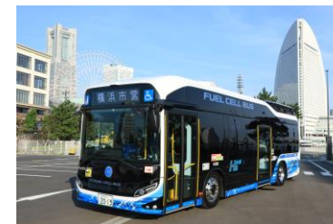
(横浜市交通局の燃料電池バス)