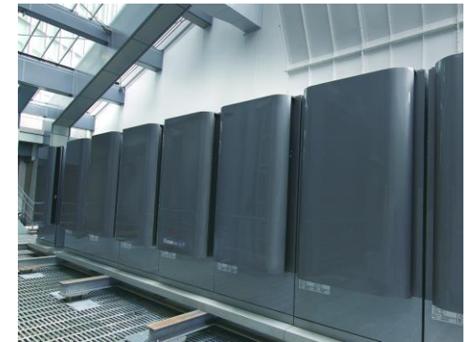
(横浜市燃料電池システム)