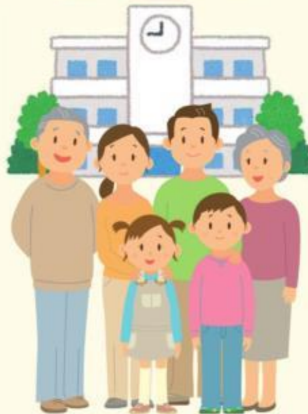
គណកម្មការអប់រំរបស់ខេត្តខាណាហ្គាវ៉ា