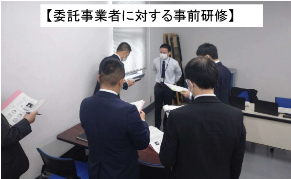
【委託事業者に対する事前研修】