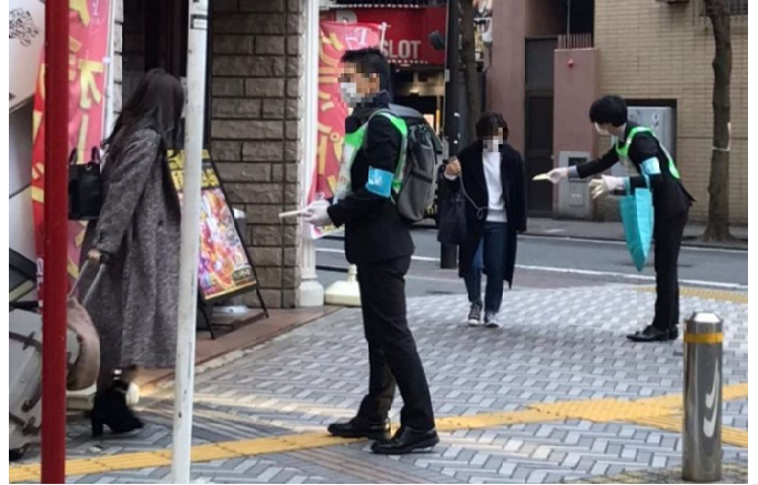
【ポケットティッシュ配布による外出自粛の呼びかけ】