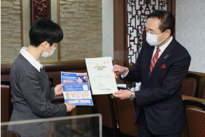
【飲食店への協力を呼びかけ】