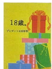
神奈川県立上矢部高等学校2年 田尻 明日香