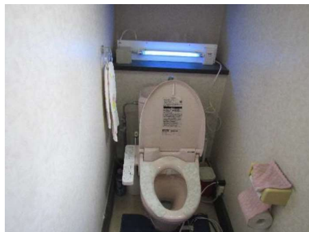
トイレに設置したイメージ (右)

殺菌灯と人感センサーを合わせた商品で、多くの方が使用するトイレや個室に置き利用できます。殺菌灯の光は直接見る、または肌に長時間浴びると人体には良くないため、人感センサーで人を感知すると自動で消灯、自動で復帰する仕組みになっており、実用新案に登録した商品です。