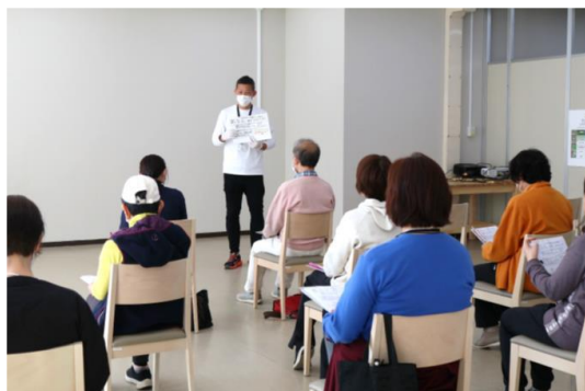
▲フレイル予防セミナー