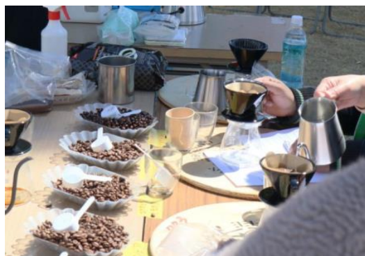
▲コーヒーブレンド体験