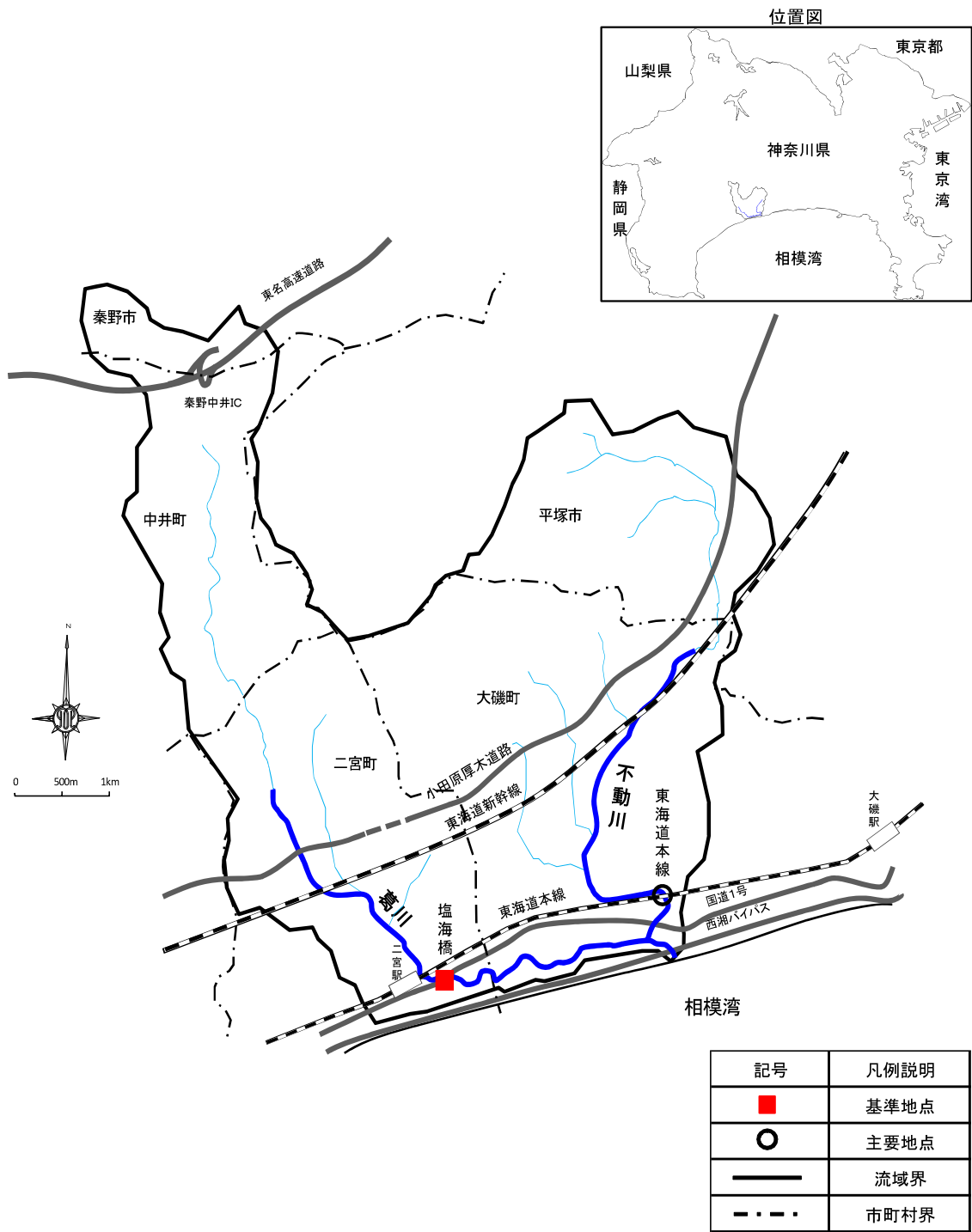
＜参考図＞葛川水系流域概要図