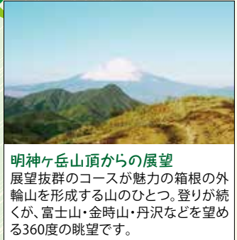
明神ヶ岳山頂からの展望 展望抜群のコースが魅力の箱根の外輪山を形成する山のひとつ。登りが続くが、富士山・金時山・丹沢などを望める360度の眺望です。