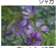
シャガ 青いカタバミ草