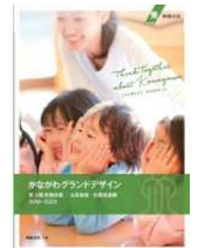
主要施策・ 計画推進編