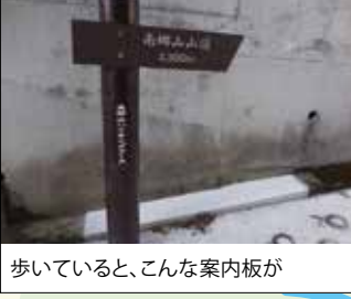
歩いていると、こんな案内板が

いい景色の中で楽しくパークゴルフ! 湯河原町総合運動公園 パークゴルフ場 緑豊かな丘陵地にあり、全面に相模灘や伊豆半島を望む、優れた景観の中でプレーを楽しむことができるパークゴルフ場です。 【住】足柄下郡湯河原町吉浜1987 【電】0465-63-7288 【営】9:00～(閉場時間は営業月により変更) 【入】大人200円/回 子供100円/回 【休】毎週木(木が祝日の場合はその前日)、年末年始 【HP】 https://www.town.yugawara.kanagawa.jp/soshiki/5/1416.html