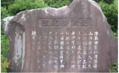
青年会が設置した小道地蔵寺屋敷跡の碑