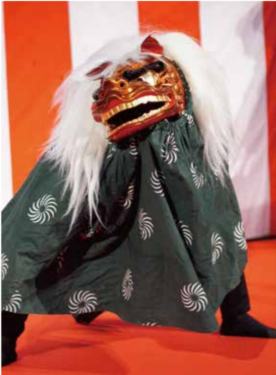
相模里神楽垣澤社中

「神楽」とは、人々の祈りを八百万の神々へ伝え、人々に喜びと幸を届ける大切な使命を持った芸能です。垣澤社中は、明治45年に江戸で発展し相模地方に伝わった「神楽」を受け継ぎ、その後神奈川県厚木の地で100年にわたり「相模里神楽」を守り伝えてきました神楽社中です(厚木市指定無形民俗文化財)。今回は、「疫病退散」「無病息災」を願う「寿獅子・両面踊り」をご披露申し上げます。厄祓いの獅子舞や岡目ひょっとこが幸を願って舞い踊る祭の演目です。