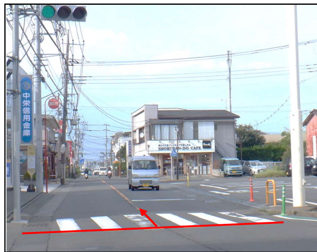
起点(サンライフ入口交差点)