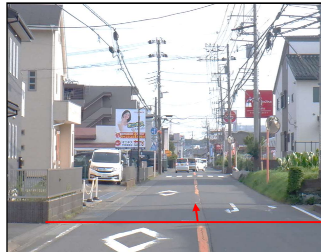
終点(落幡バス停付近)