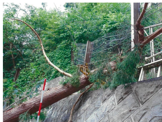
フェンス破損（被害箇所⑪）