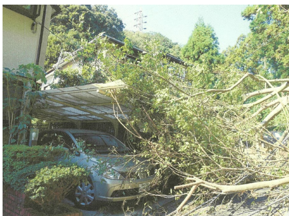
車庫、塀破損（被害箇所②）