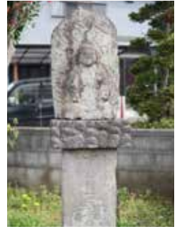
上井ノ口の大山道道標

大山道とは、各地から庶民の信仰の対象とされた大山にある阿夫利神社へ参詣者が通った古道の総称。大山街道とも呼ばれます。町のあちこちで眺められる大山を見ながら、昔の人が歩いた道をたどってみるのも面白いでしょう。