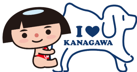
神奈川県PRキャラクター かながわキンタロウ

せいかつ ほ ご りよう 生活保護を利用するにあたって知っておいていただきたいことや、ひつよう てつづ 必要な手続きについて書いてありま す。