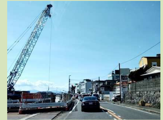
施工状況（東側工区）