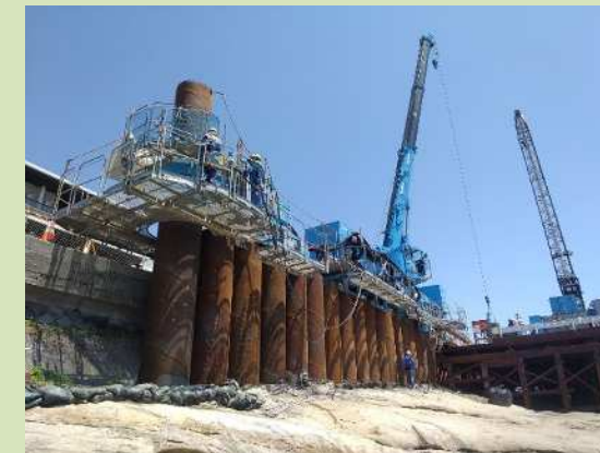
施工状況（西側工区）