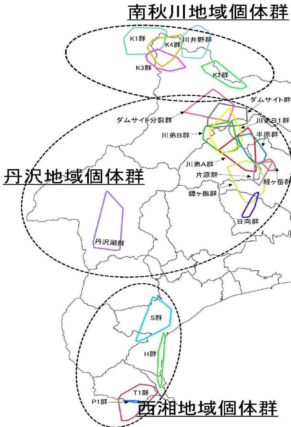
図2 令和2年度加害群の行動域

加害群について、ラジオ・テレメトリー法及びGPS発信器により行動域調査を実施した。行動域及び近年の変化は次のとおりであった。