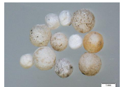
写真2 クッションビーズ封入材