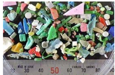
県海岸に漂着したマイクロプラスチック

九州大学の調査によれば、日本の周辺海域は、マイクロプラスチックの漂流量が世界平均の 27 倍も高いことがわかっており、マイクロプラスチックのホットスポットともいわれています。県の沿岸でも、マイクロプラスチックを海岸で簡単に拾い集めることができます。