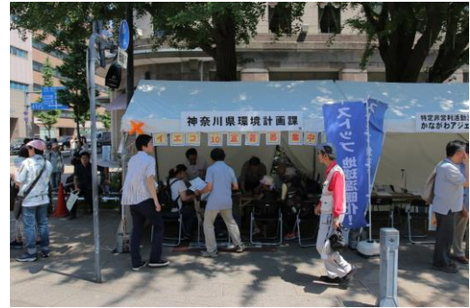
「地球環境イベント かながわエコ 10 フェスタ」の様子

「私たちの環境行動宣言 かながわエコ 10（てん）トライ」の周知及び浸透を図ることを目的として、「地球環境イベント かながわエコ 10 フェスタ」を開催しています。平成 30 年度は 5 月 26 日・5 月 27 日に横浜公園で開催しました。