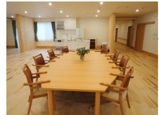
県産木材施設(老人福祉施設聖アンナの家)