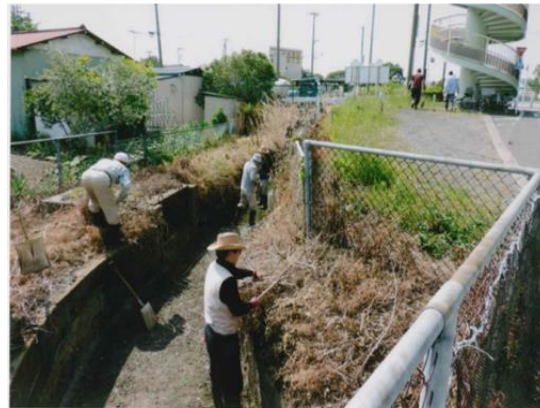
用水路の草刈り等による維持補修活動 (多面的機能支払事業 平塚市 城所地区)