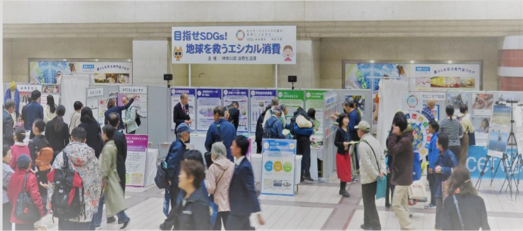
「目指せSDGs! 地球を救うエシカル消費」イベント(平成29年度開催)

* 「消費者市民社会」：消費者教育推進法では「消費者が、公正かつ持続可能な社会の形成に積極的に参画する社会」と定義されています。