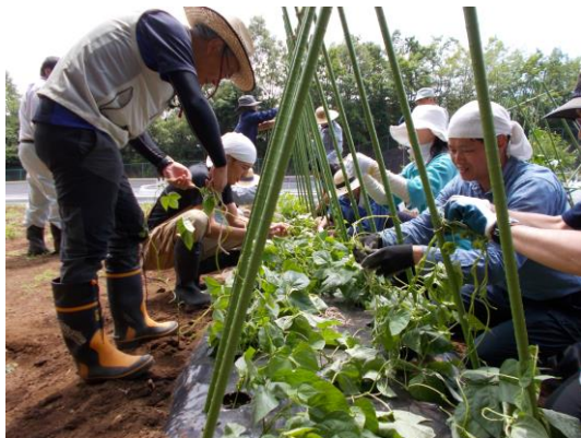
農業研修を受ける研修生 (中高年ホームファーマー事業)

地区(1,127ha)で、「多面的機能支払事業」により、農地や農業用水等を保全する地域の取組や活動に対して助成しました。