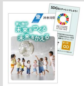
「買い物が未来をつくる未来をかえる」リーフレットと「SDGsゴール12」カードセット(平成30年度発行)

http://www.pref.kanagawa.jp/docs/r7b/cnt/f535323/p1096044.html