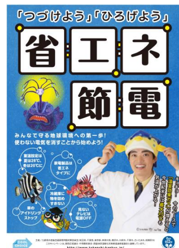
「ライフスタイルの実践・行動」 キャンペーンポスター

こうした様々な取組によって、県民の間で地球温暖化対策及び節電の必要性についての認識は着実に広まっていますが、日常生活において具体的な実践行動に結びつけていくためには、今後も、身近なところから一人ひとりが実践していくことを促す普及啓発を続けていく必要があります。