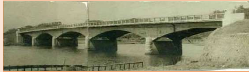
【建設当時の花水川橋】