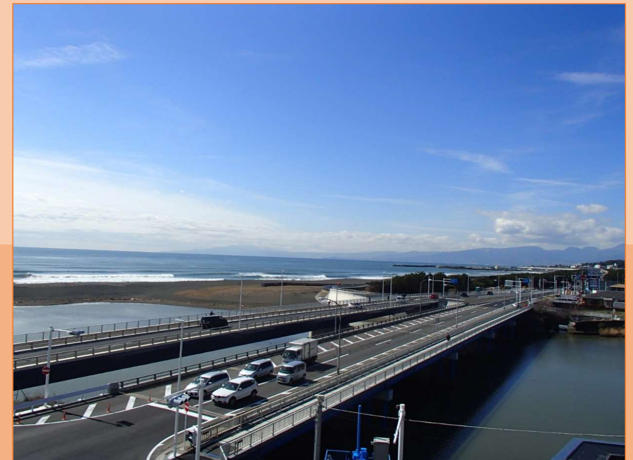
【下り線建設後の様子】