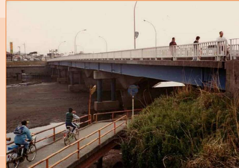
【建設当時の人道橋】