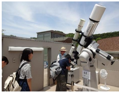
「かわさき宙と緑の科学館」の屋上にはコンピュータ制御の大型望遠鏡が4台設置されています。昼間でも星が観測できる屈折式望遠鏡です。