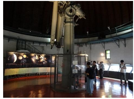
「国立天文台」では日本最大の屈折式望遠鏡を見ました。望遠鏡を見慣れている高校生たちも、口径 65cm、長さ 11m の大きさにはビックリでした。