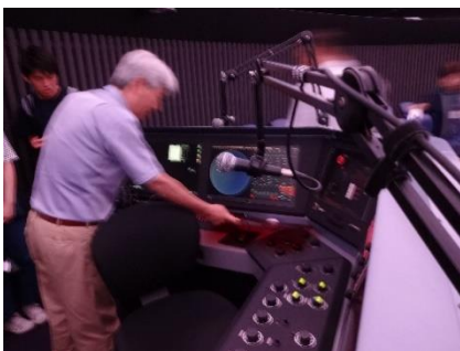
「かわさき宙と緑の科学館」の世界最高水準のプラネタリウムの投影を見た後、操作した技術員の方から操作盤について解説してもらいました。